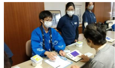
地区センター祭り(ボランティア)