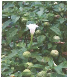
チョウセンアサガオの葉と花