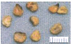
チョウセンアサガオの種