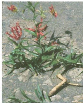
地下部を付けたグロリオサ全体