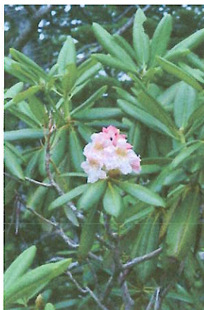
ハクサンシャクナゲ