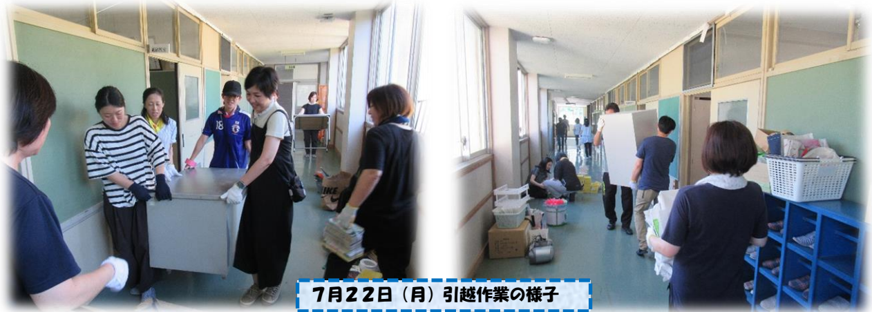
7月22日（月）引越作業の様子

北舎1階工事を7月23日（火）からスタートするにあたり、7月22日（月）8：30から、令和4・5・6年度のPTA 本部役員さんと教職員で、引越作業を行いました。1時間ほどで作業は終了しましたが、これからも引越作業が続きますので保護者の方だけでなく、子どもたち（危険でない作業）・地域の皆様にもご協力いただくことができると思います。ご理解のほど、よろしくお願い致します。