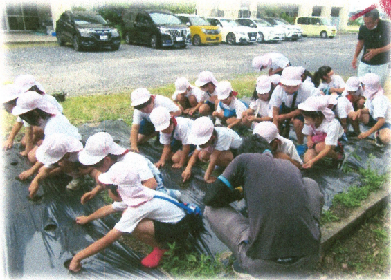
JAの方にお越しいただき大豆を植えました。