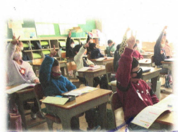
漢字練習をかんはっている / 年生

冬休み中に作った料理を紹介し合う6年生 クラスの仲間と出会う。思わず笑顔になる子どもたち