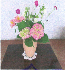
職員玄関前の花 地域の方から いただきました