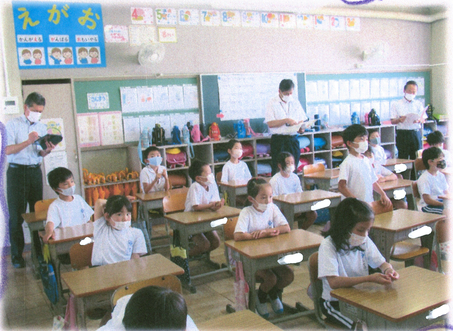
仲間と共に学ぶ 子どもたち