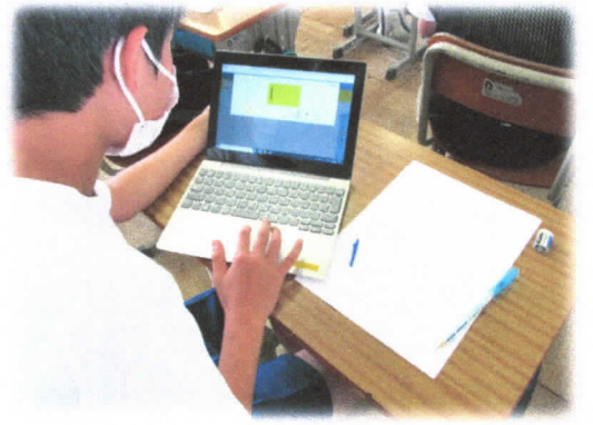
6年生 総合的な学習の時間