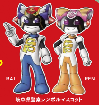
岐阜県警察シンボルマスコット