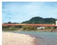
橋: 美濃市・長良川 美濃橋