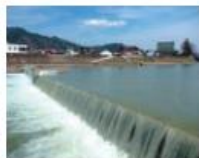
取水堰: 飛騨市・宮川 大久吉堰