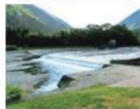
堰堤: 揖斐川町・粕川