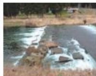
床止め工: 高山市・荒城川