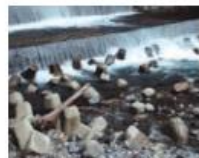
水制: 下呂市・小坂川

川ぞこを守るために、川ぞこにコンクリートブロックが並べられていることがあるよ。すきまに、はさまれたり、強い流れに引き込まれたりすることがあるのでぜったいに近づかないで!