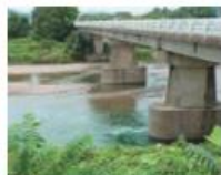
橋: 岐阜市、関市・武儀川 千足橋