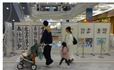
作品展示【イオンモール各務原インター】

受賞作品は、各赤十字施設(岐阜県支部、高山・岐阜赤十字病院、岐阜県赤十字血液センター)や県内各地において、展示させていただく予定です。展示場所、期間等が決定しましたら、対象校(園)にご連絡させていただきます。