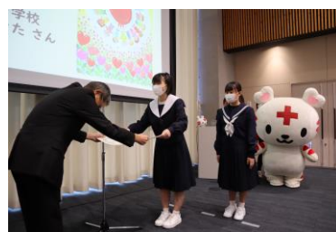
表彰式【日本赤十字社岐阜県支部】