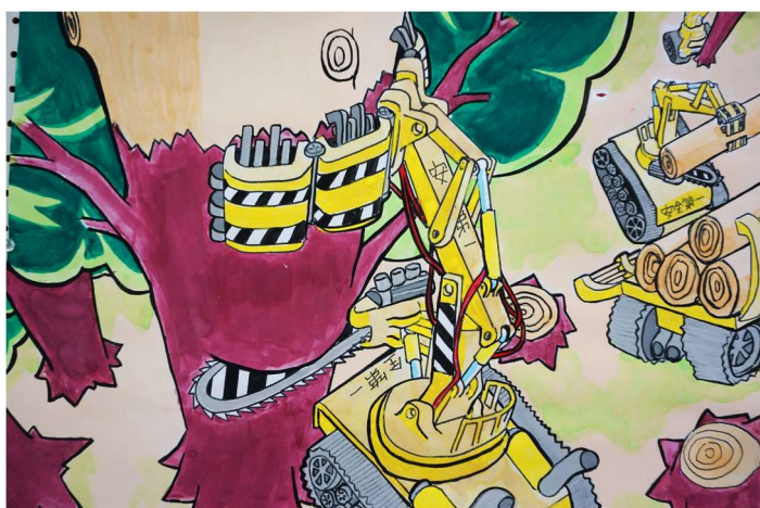
第40回 可児・御嵩 発明くふう展 絵画金賞