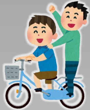
ふたりの 二人乗り