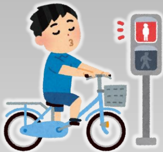
しんごう むし 信号無視などの違反