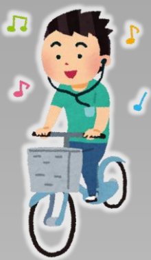
イヤフォンなどをつけたまま