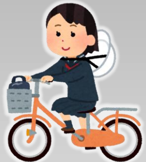
ヘルメットをきちんとかぶって いない

「誰かが見ているから」ではなく、 あなたや周りの人の命を守るために 自転車の安全な利用を心がけてください。