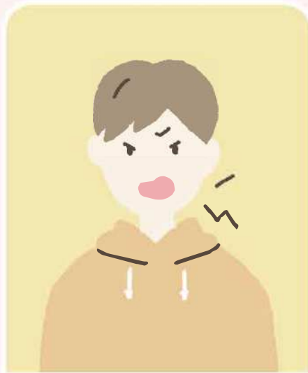
怒りやすくなった