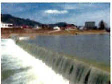
取水堰: 飛騨市・宮川 大久古堰 みやがわのおおくこせき