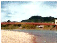
橋: 美濃市・長良川 美濃橋 ながらがわ のぼし