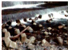
水制: 下呂市・小坂川 おさかがわ