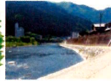
下呂市・飛騨川 ひだらがわ

上流にダムのある川では、放流による増水に注意してね。事前に放流情報を確認し、川岸で遊んでいるときは常に放流予告のサイレンに耳を傾けよう。また、急に増水するところではぜったいに子どもだけで遊ばないで!