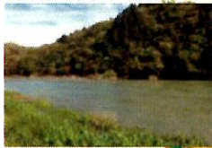
関市・長良川 池尻地区 ながらがわ いけしりちく

一見おだやかに見える流れも、川ぞこの影響で流水は一定ではないんだよ。川の事故の約90%はこのおだやかな流れで発生しているよ。近寄る際はライフジャケットを必ず着用しよう!