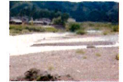
美濃市・板取川 いたどりがわ