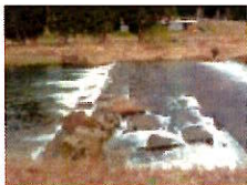
床止工: 高山市・荒城川 あらかがわ