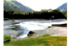
堰堤: 揖斐川町・粕川 かすかわ