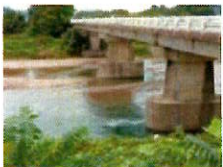
橋: 岐阜市、関市・武儀川 千正橋 むきがわせん のちよし