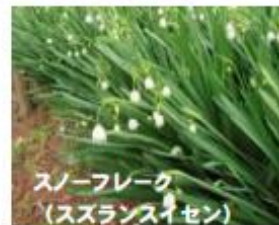
スノーフレーク (スズランスイセン)