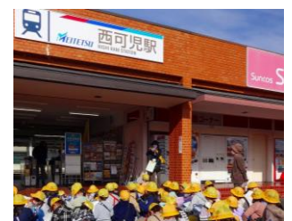
2年まちたんけん：西可児駅