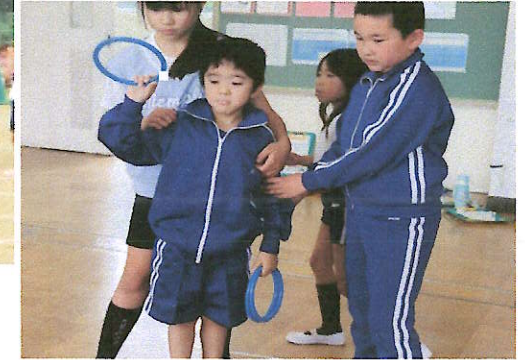
〈日常〉 ・頻繁に全学年、職員での交流