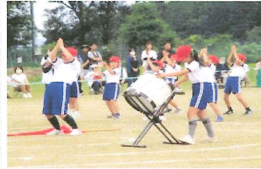
〈運動会〉 ・下級生を率いる頼もしい6年生