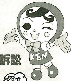
人権イメージキャラクター 人KENあゆみちゃん