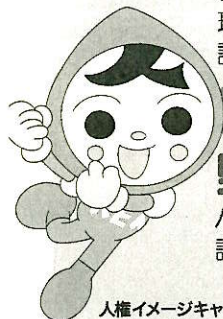
人権イメージキャラクター 人KENまもる君