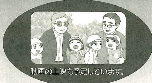
動画の上映も予定しています。