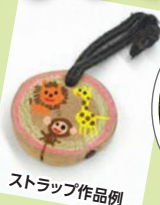
ストラップ作品例