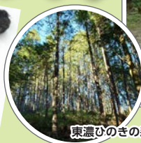
東濃ひのきの森林