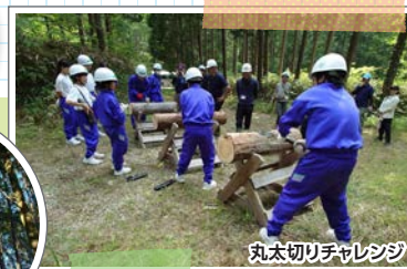
丸太切りチャレンジ