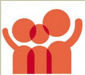
「家庭の日」シンボルマーク