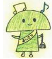
土田小オリジナル キャラクター【はとみん】