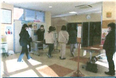
家庭教育学級役員さんによる受付

子どもは、愛すべき「私とは別の世界の人」 ・その子の特性を知る。 ・自分の世界も伝える。 ・わからなくても付き合う。