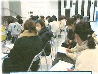
隣席の方との意見交流

この講座は、家庭教育学級生や子育て中の保護者、子育てに関心のある方を対象に、可児市子育て支援課が、年5回開催しています。