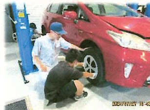
⑧ 自動車の整備体験