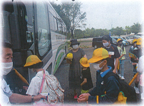
消毒をしてから、バスに乗りました

外国の衣食住の体験活動を通して、国際理解の勉強としてきました。雨予報でしたが、6年生が出発するころにはやみたくさん、学ぶことができました。