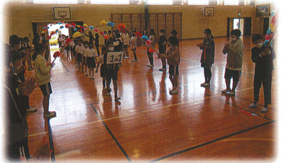
メダルもかけ、マーチの中も多く1年生